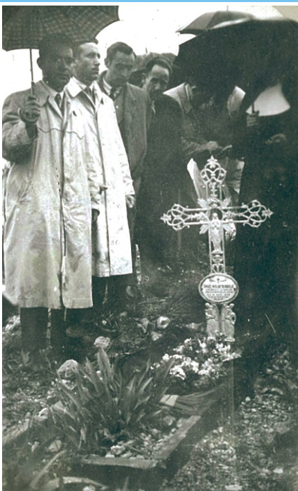
Panteón de Zaragoza