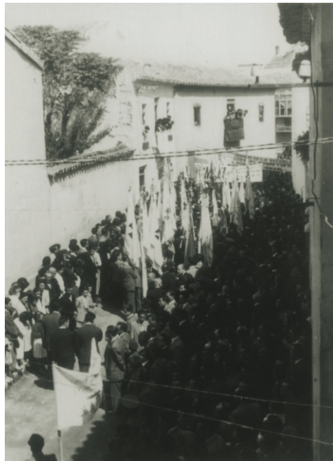
Homenaje ante la casa donde vivió

Por eso la divulgación de tu vida es primordial para muchos y tus homenajes y recuerdo necesario. Cuantos que al conocerte, verte tan asequible, tan similar a ellos, se animen a dar el paso de tu caminar