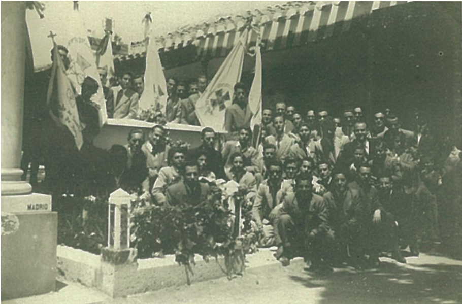
Panteón de Tomelloso

como si a tu muerte hubiera que unir la de tu recuerdo, ha envuelto todo lo que a ti concernía.