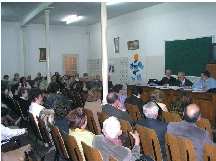
Asamblea Constituyente de la Asociación.

El 17 de diciembre de 2006 se celebró la Asamblea General Constituyente de la Asociación, que