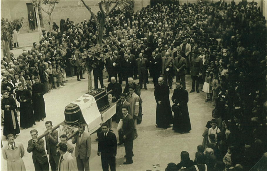
Traslado de los restos a la salida de la iglesia de Tomelloso

Providencia, sin duda; pues el Señor, como se sabe, tiene sus horas y sus planes, y la luz, como dice el Evangelio, no está para esconderla debajo del celemín.